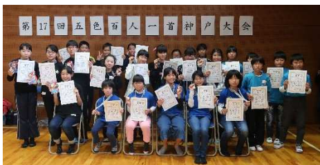
第17回大会 入賞者のみなさん